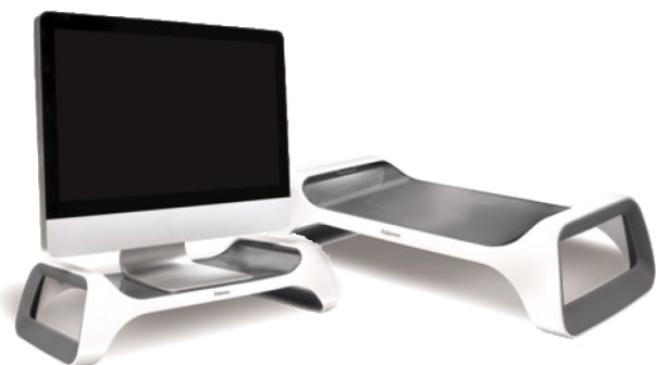
Soportes para Monitor