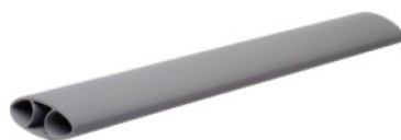
Reposamuñecas para Teclado