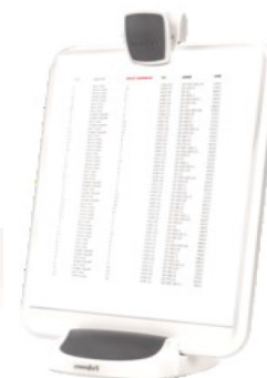
Atriles Multiusos 4 en 1