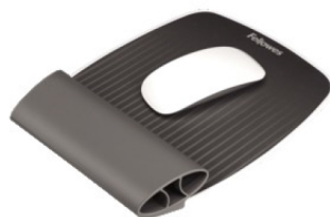
Mouse Pad con reposamuñecas